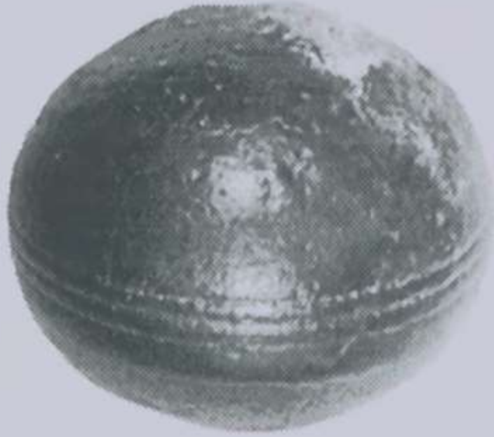
Figure 6.9. A metallic sphere from South Africa with three parallel grooves around its equator. The sphere was found in a Precambrian mineral deposit, said to be 2.8 billion years old.

Facture: The spheres are found in pyrophyllite, which is mined near the little town of Ottosdal in the Western Transvaal. The pyrophyllite is a mineral created by metamorphism at moderate temperature and burial depths of over several kilometers. Such metamorphism has significantly altered the original clays or volcanic ashes into greenschist grade