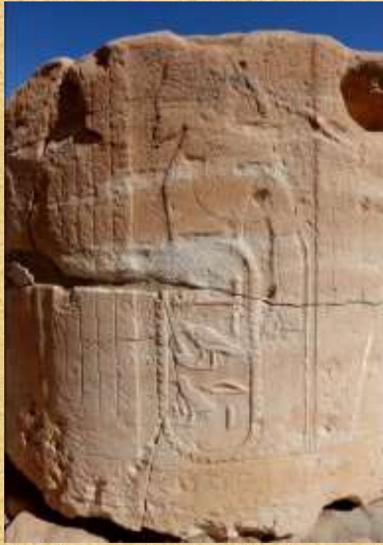
وكل منهم يحدد اسم بلادهم