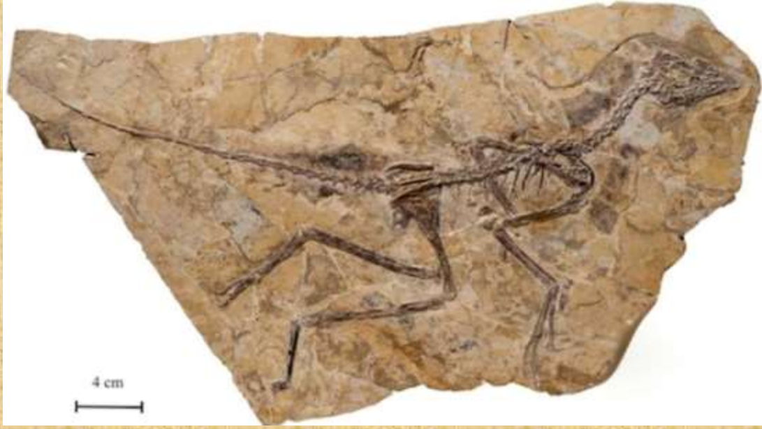
وبجممة ديناصور صغير