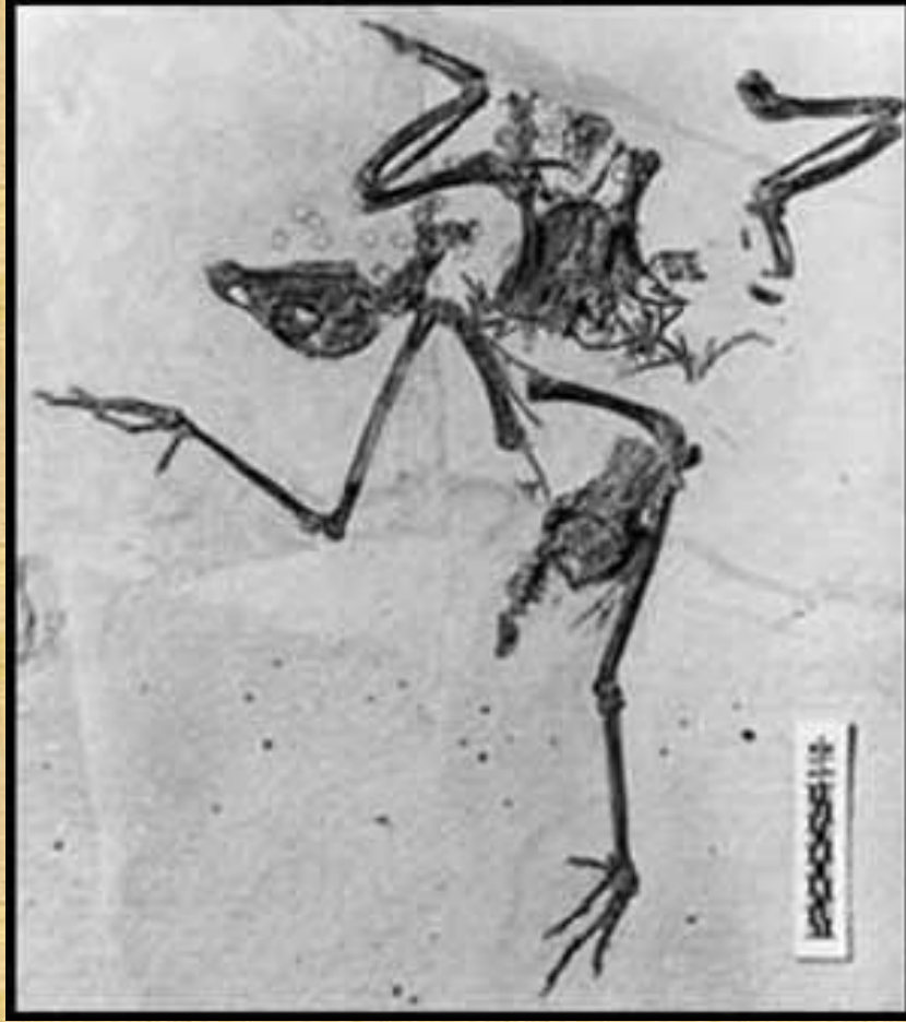
والذي صغيره به مخلب في جناحه