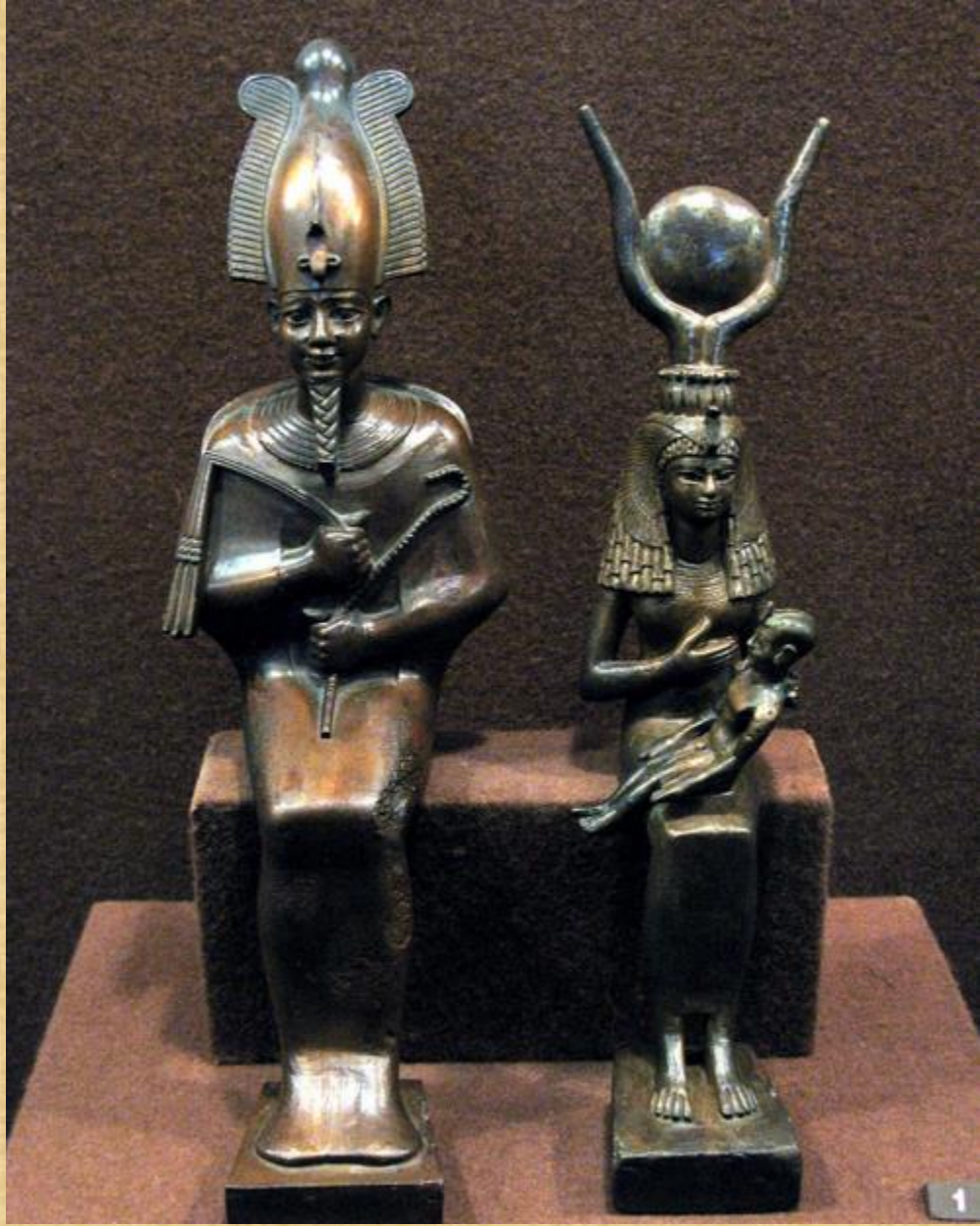
واخر في متحف اللوفر