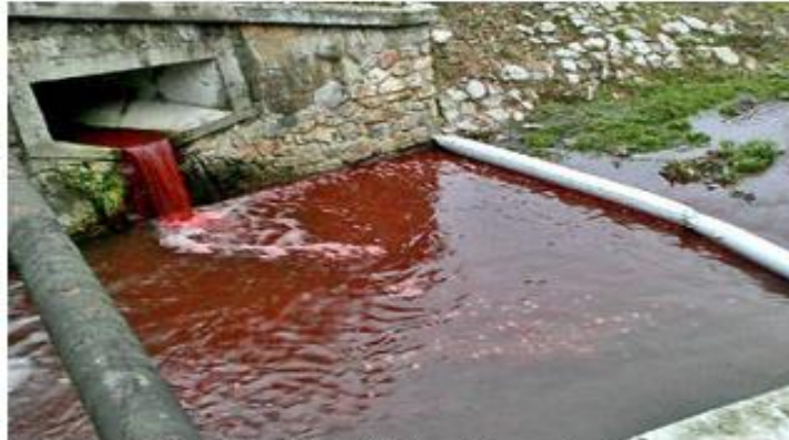
Horror: Residents in the small town of Myjava in Slovakia awoke to a river red as blood

Rumours were rife in a Slovakian town this week when a river running through turned bright red. The river in Myjava, a small municipality on the border to the Czech Republic, had changed colour over night and turned into 'blood'. Police have been called in to investigate the matter, but it is believed to be a faulty filtering system from a slaughterhouse upstream.