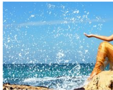
Sorry folks, it's just a costume

She said that at least two people had written to the agency asking about the creatures.