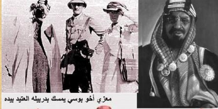
معزي أخو بوسي يمسك بدرييله العتيد بيده