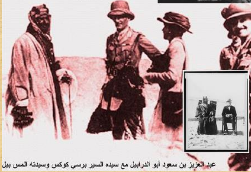
عبد العزيز بن سعود أبو الدرايزيل مع سيده السير برسي كوكس وسيدته المس بيل

وأيضاً المس بل اليهودية التي تزوجت عبد العزيز ال سعود وهي عضو المكتب الهندي للمخابرات