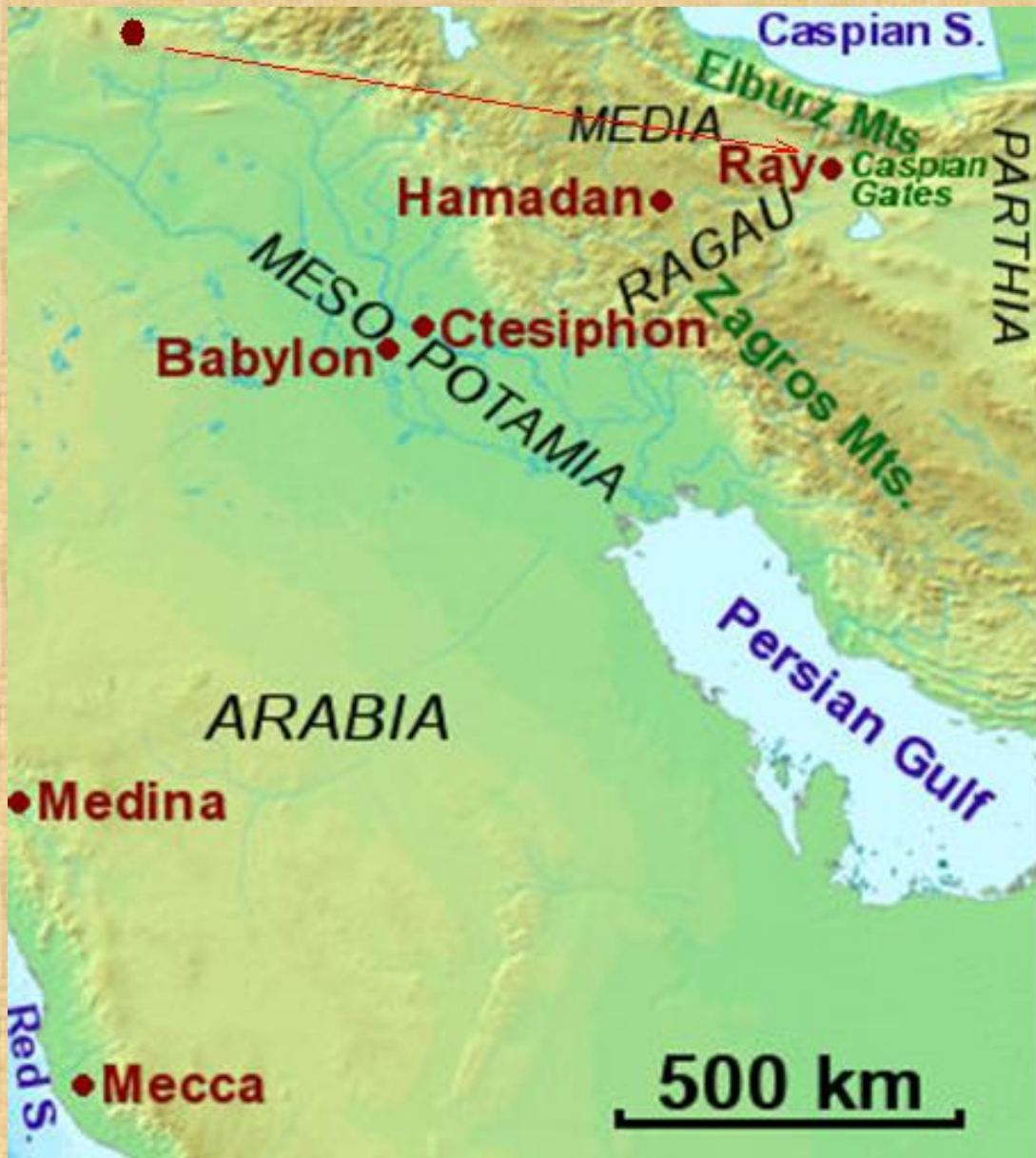
بل وصورة الطريق