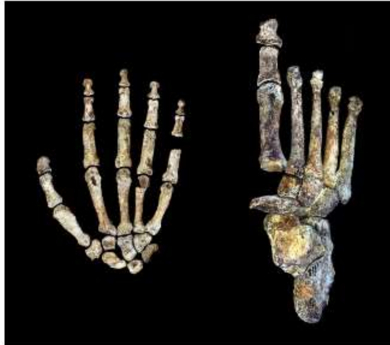
The discovery of Homo Naledi has led to a recent debate

The discovery of an unknown human species from South Africa last year created a sensation that jolted the paleoanthropology community and captured public imagination. Furthermore, the core