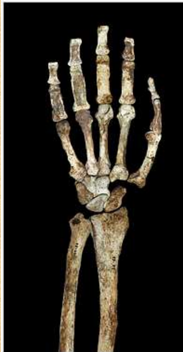
The hand and forearm of MH2. Palmar view

The nearly complete wrist and hand of an adult female from Malapa, South Africa presents Australopithecus-like features, such as a strong flexor apparatus associated with arboreal locomotion.