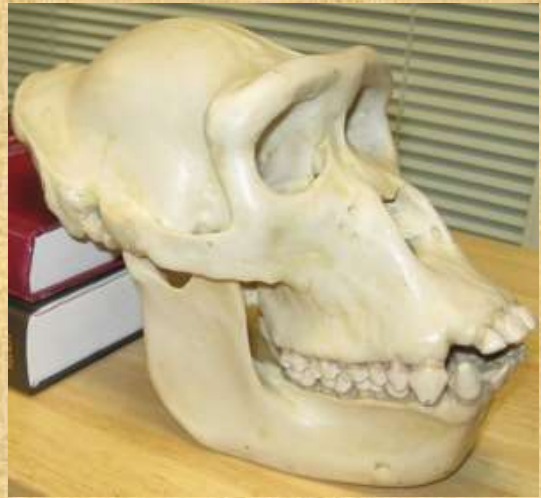
Australopithecus sediba from South Africa.