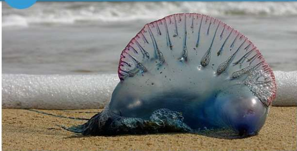
The Portuguese man-of-war is weird-looking sea creature with a venomous sting.

With its mohawk-like feature, the Portuguese man-of-war is a decidedly punk-rock sea creature. But that's just one of the many odd and interesting facts about this organism — or should we say organisms?