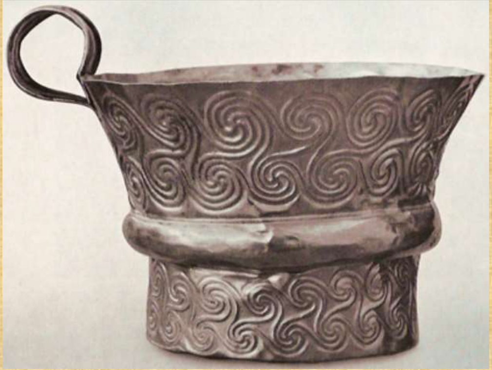
Cup from Grave V, with swirly designs