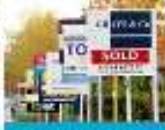
Home owners in London earning