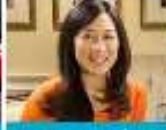
He has graduated to a nicer hoodie