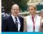
Prince Albert and Princess Charlene