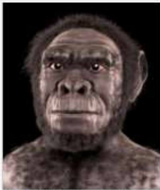
Homo habilis - Forensic facial reconstruction/approximation