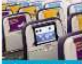
Is this FINALLY the end of air rage?