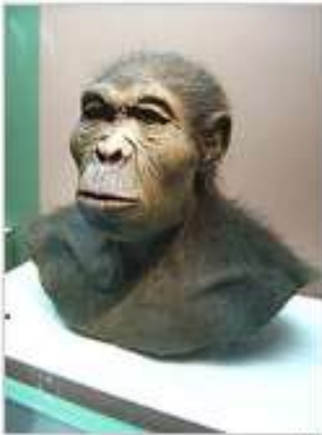
Reconstruction of Homo habilis at the Westfälisches Museum für Archäologie, Herne