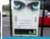
Do not walk your dog near Muslims