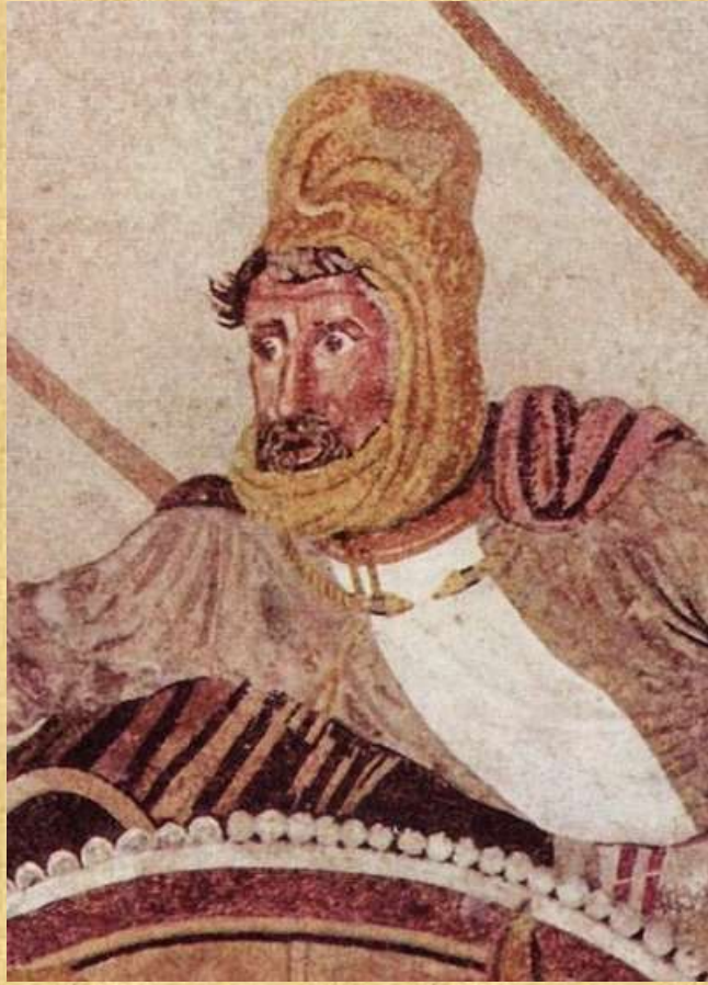
Detail of Darius III from the Alexander Mosaic