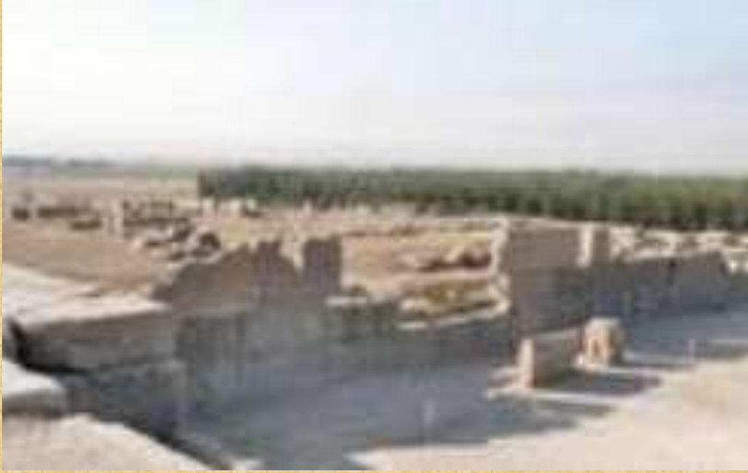
Ruins of King ARTAXERXES I's palace in Persepolis