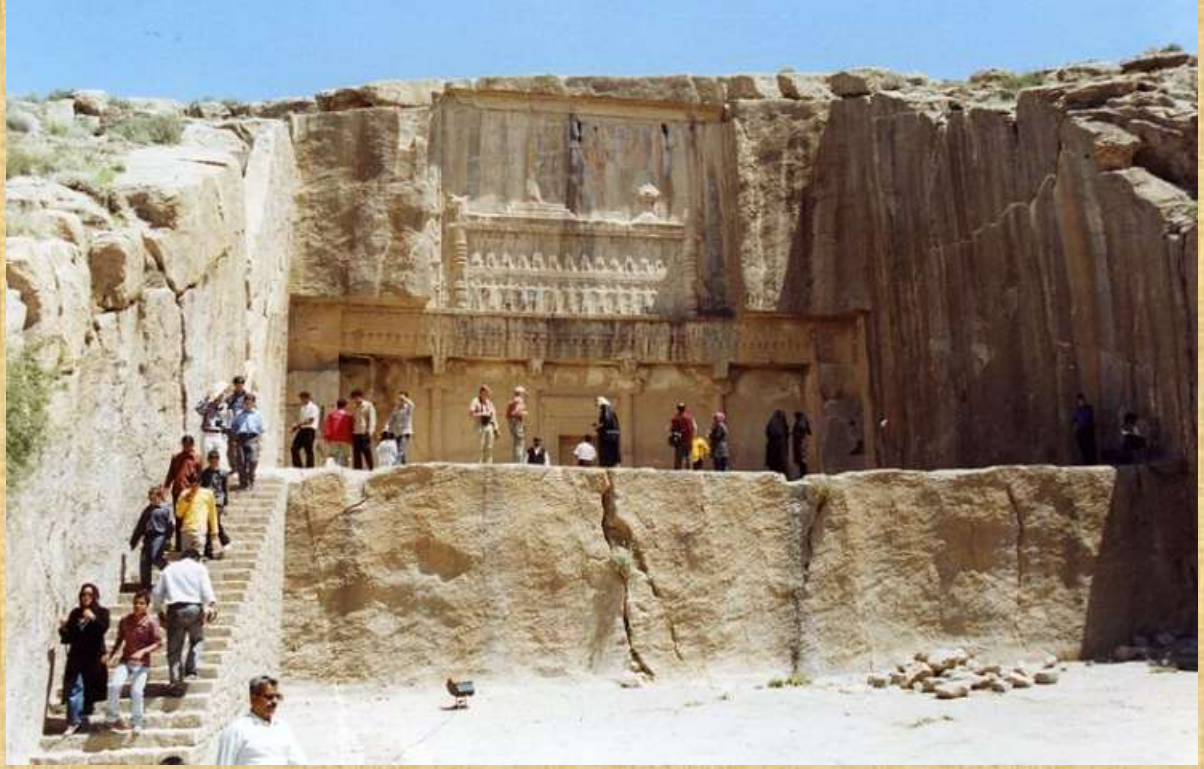
Tomb of Artaxerxes III at Persepolis

والسبب انه لم ينتهي من بناء مبنى كبير كقصر له ولكنه مات قبل ان يكتمل وباقي اجزائه حتى الان