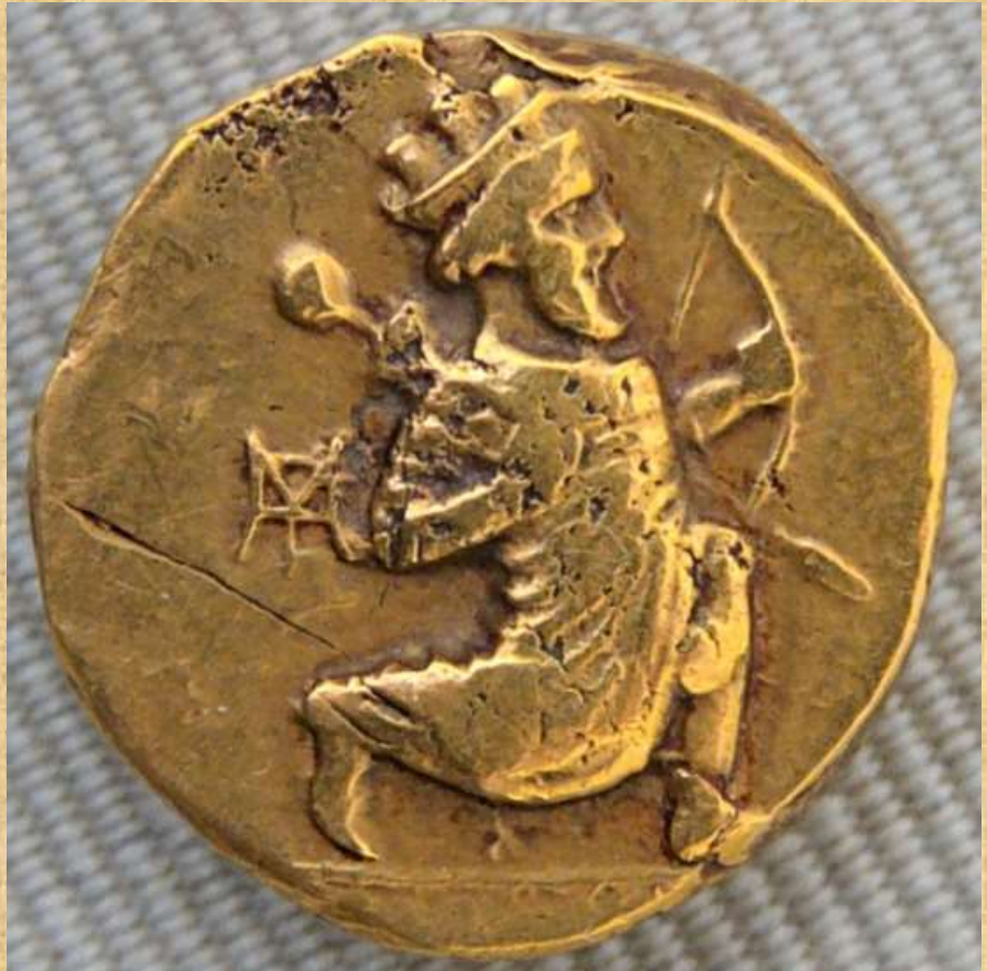
Daric of Artaxerxes II