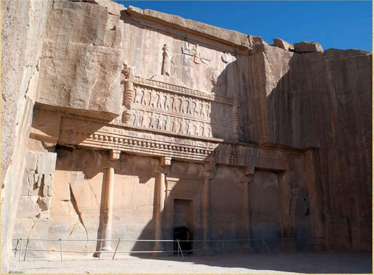
Tomb of Artaxerxes II in Persepolis

وأیضا اختتم بدلیل هام جدا وهو قبره الموجود حتى الان شاهدا على وجوده التاريخي