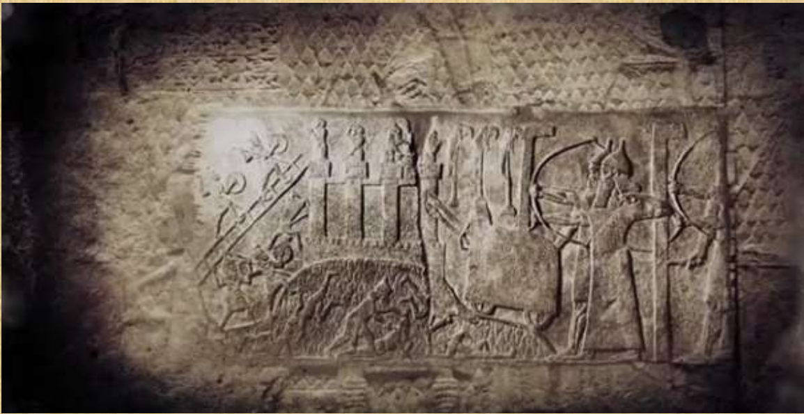
وأیضا لوحة ليهود مأخوذین في السبي وينحنون امام سنحاريب