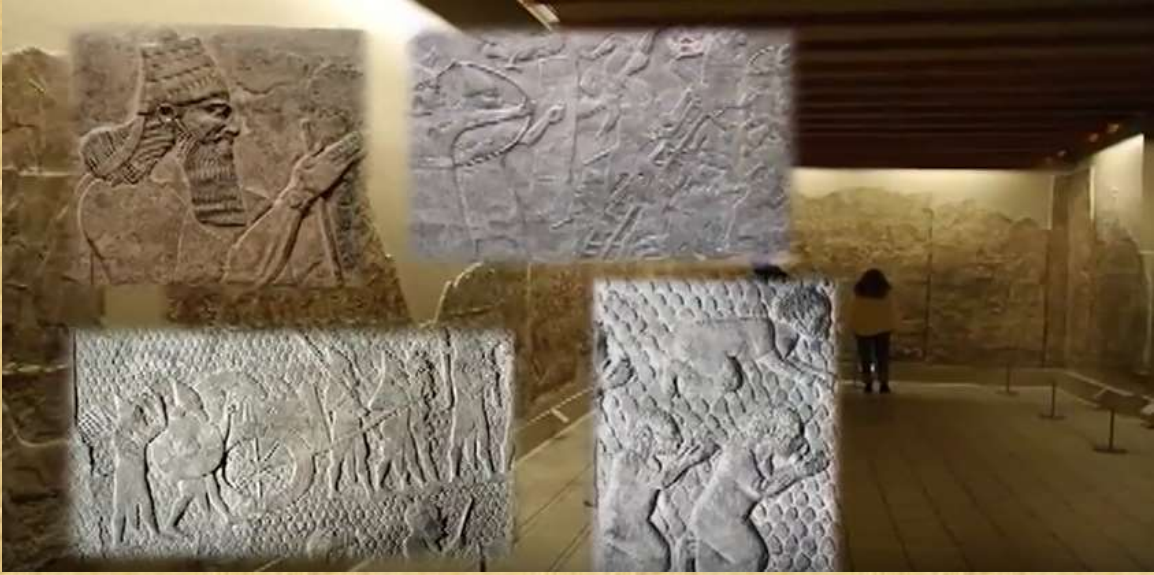
وتم تدميرها بواسطة الجيش