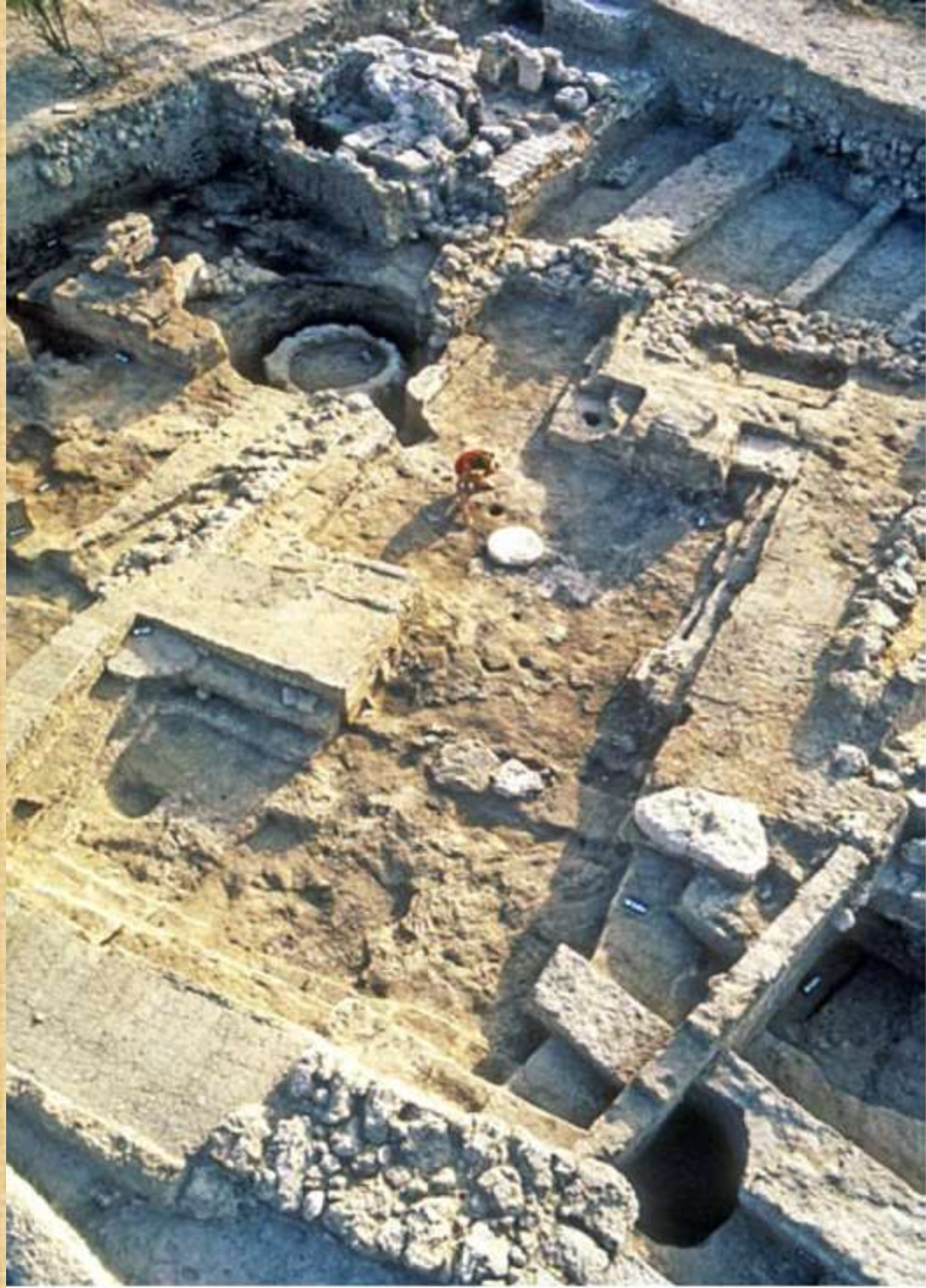
Amshai Mazar/The Hebrew University of Jerusalem

فكما قلت هو يطابق الوصف الكتابي ولكن على اصغر لان هذا سطحه هو 47 قدم في 26 قدم