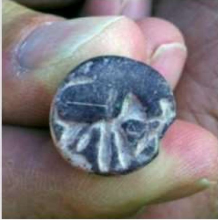
The "Samson seal" found at Beth Shemesh.