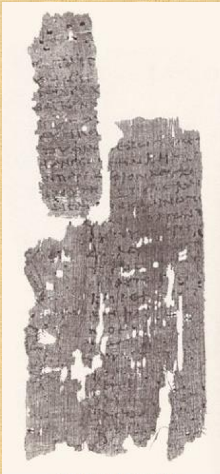
p098 Rev 1.13-2.1 ll.jpg